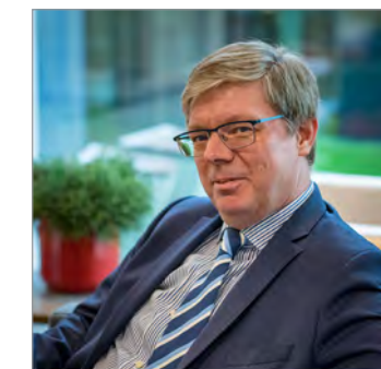
Auteur: Marc De Munter Tax Partner